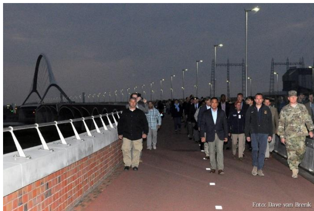
20 september 2016