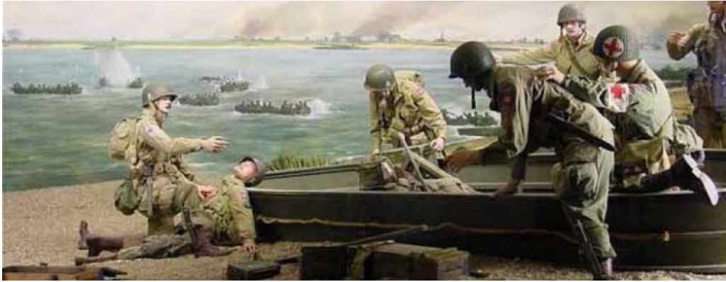
Panoramabeeld van de Waalcrossing (Bevrijdingsmuseum Groesbeek)

Tijdens deze zogenaamde "Waalcrossing" zijn 48 geallieerde militairen omgekomen. Op de brug heeft Atelier Veldwerk een lichtmonument, genaamd "Lights Crossing", gerealiseerd. Dit lichtmonument op de nieuwe brug is heel speciaal. Er staan 48 paren lichtmasten op de brug, één paar voor elke gesneuvelde militair. Rond het tijdstip van zonsondergang worden deze lichtmasten, per paar, na elkaar ontstoken in wandeltempo. Totaal duurt het ontsteken bijna 12 minuten. Het eerste paar dat wordt ontstoken staat onder de zuidelijke boog van de brug. De omgekeerde V.