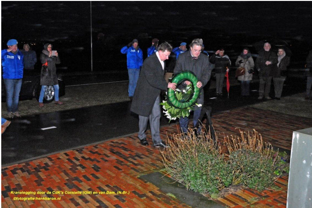
CdK's Gelderland en Noord-Brabant leggen krans bij Waalcrossing monument.