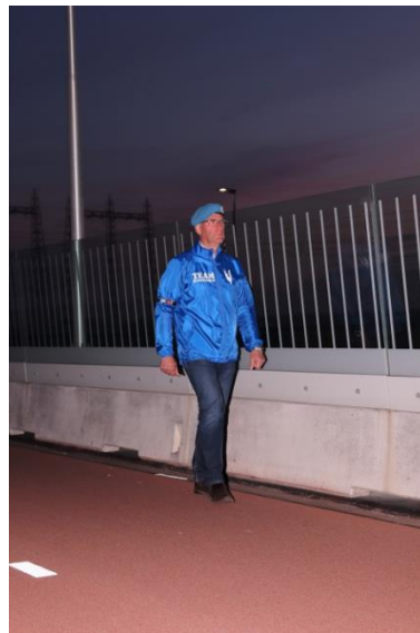
Veteraan loopt Sunset March

Iedere avond loopt een veteraan de Sunset March bij zonsondergang over de brug van zuid naar noord. Als het eerste paar lichtmasten wordt ontstoken, loopt de veteraan mee in het tempo waarin de lichten aangaan.