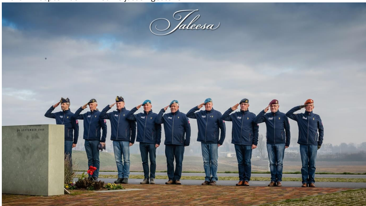
9 leden van het Team in de nieuwe jassen van Kersten Retail

Dankzij de genereuze bijdrage van Kersten Retail uit Elst wordt het gehele Team Sunset March in september in nieuwe jassen gestoken.