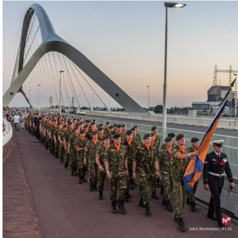
Contingent 4daagse lopers